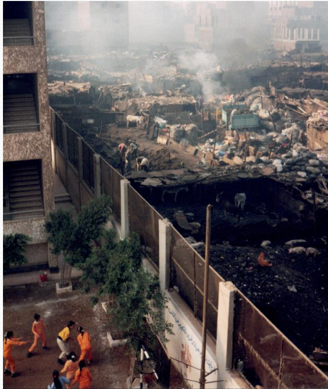
Die Schule und der Schulhof ...