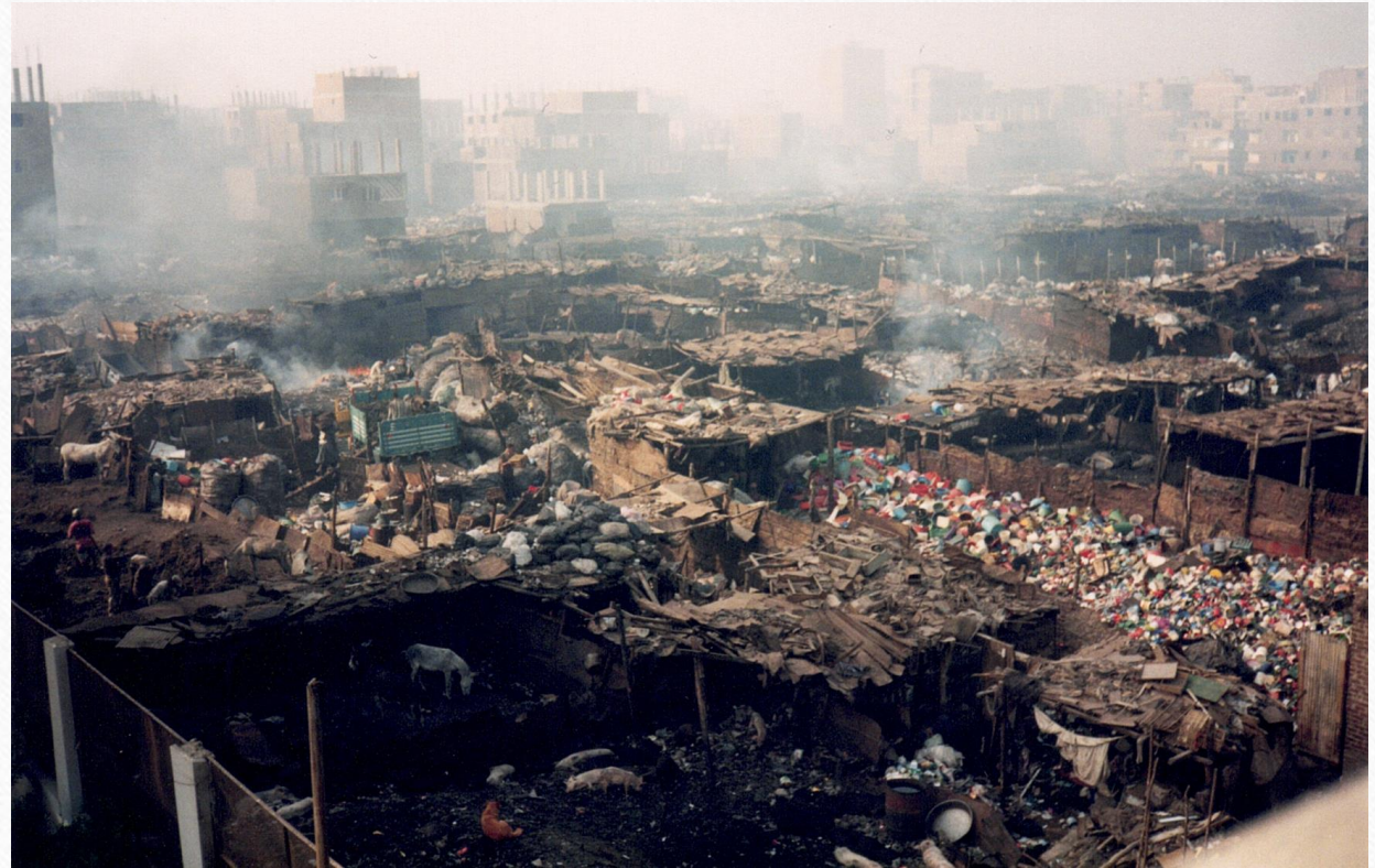
... liegen direkt neben dem Müllgebiet.