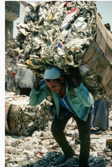
oder zu Fuß