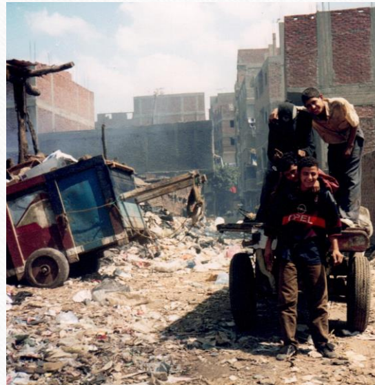
Fahrzeugen mit Anhängern